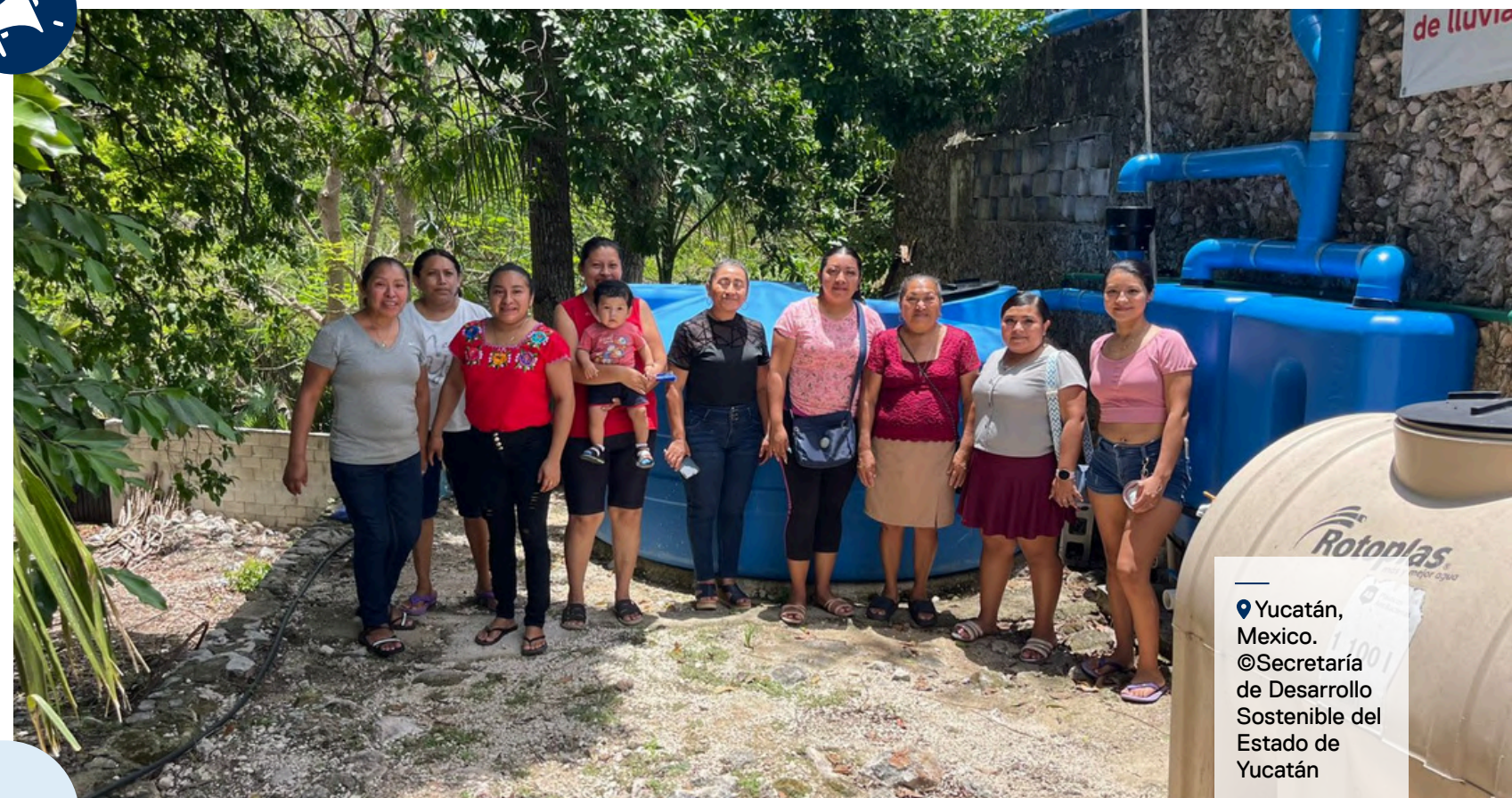
Yucatán, México.