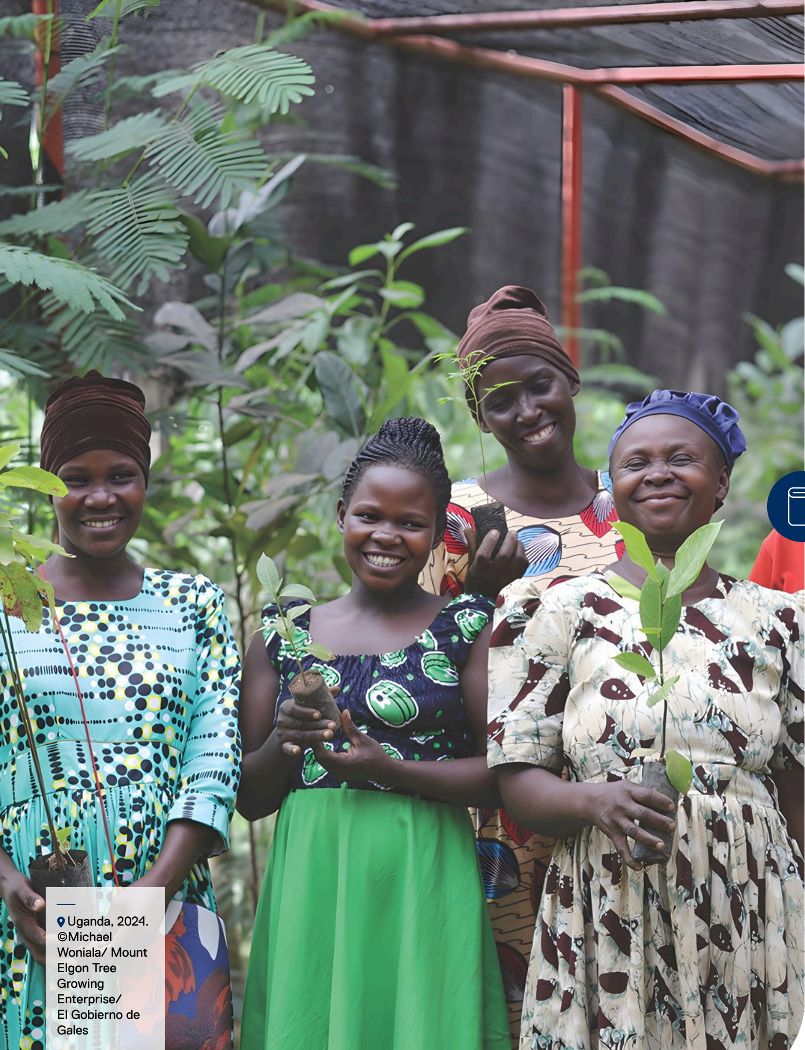
Uganda, 2024.